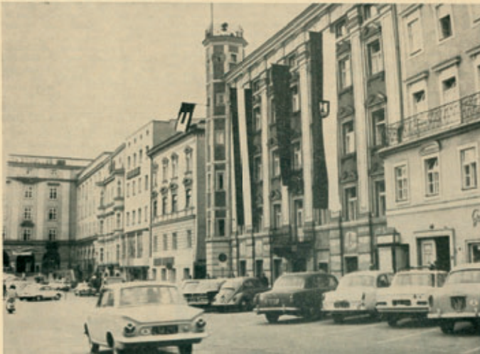
Europa-Fahnen wehen vom Linzer Rathaus (vom Eckturm die Fahne der europäischen Bewegung, das grüne E, in der Mitte die Fahne des Europarates). Dank der Initiative der EFB haben die Bürgermeister in zahlreichen Gemeinden, darunter in Wien, Graz und Linz (obiges Bild) die Europa-Fahnen gehißt.

Seite 4 Europa-Stimme Juli / August 1966