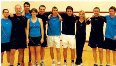
1. und 2. Mannschaft, Sektion Racketlon

Die Sektion Racketlon des RbEJ Gleisdorf wird qualitativ und quantitativ immer stärker. In der Bundesliga erkämpfte sich die 1. Mannschaft mit dem 3. Platz den Klassenerhalt in der 1. Bundesliga. Die 2. Mannschaft erspielte bei ihrem Debüt den hervorragenden 4. Platz in der 2. Bundesliga. www.racketlon.at