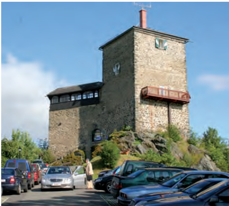
Stets aktuelle und brisante Themen werden beim Europa-Forum Neumarkt seit 1981 behandelt.

Kaum ein Thema ist so bezeichnend für den heuchlerischen Umgang mit der Europäischen Union wie die Regulierung der Gurkenkrümmung, die seit Anfang Juli Geschichte ist. Jahrelang galt sie als Synonym für die Bevormundung durch Brüssel. Doch als die angeblich so regulierungswütige Kommission der normierten Gurken den Garaus machen wollte, brandete bei vielen EU-Regierungen nicht tosender Beifall auf, sondern Kritik. Erst nach langem Ringen kam - gegen die Stimmen von Ländern wie Frankreich und Spanien und auch ohne den Sanktus Österreichs - eine Mehrheit für die Abschaffung zustande.