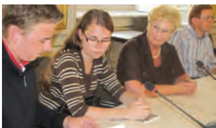
Überreichung der Resolution an Landtagspräsidentin Walburga Beutl