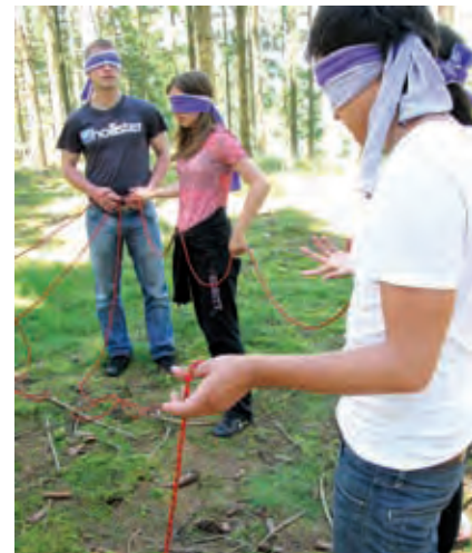
Der Outdoor-Day förderte das Zusammengehörigkeitsgefühl