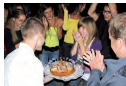
Europatorte zum Geburtstag