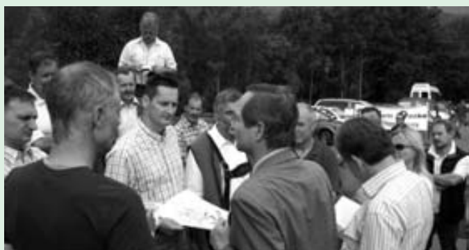
Demonstration vor den Toren des Europahauses

Die Europäische Union hat ein Akzeptanzproblem. Dies wurde vor wenigen Wochen beim negativen Referendum zum Vertrag von Lissabon einmal mehr deutlich. Das Europa-Forum Neumarkt befasste sich in diesem Jahr mit der Frage, ob und inwieweit die Regionen Europa den Menschen näher bringen können. Denn die Auffassung ist weit verbreitet, die EU sei zu bürokratisch und zu zentralistisch. Demgegenüber bieten die Regionen – wie auch die Kommunen – den Vorteil der Überschaubarkeit und der Bürgernähe. Was liegt also näher als eine starke Stellung und eine verbesserte Mitwirkung der Regionen, zu denen in Österreich und Deutschland die Bundesländer gehören, in der EU zu vereinbaren. Über 100 TeilnehmerInnen aus acht europäischen Staaten diskutierten im Europahaus Neumarkt über die EU-Regionalpolitik und auch über die aktuelle politische Situation nach dem gescheiterten Referendum in Irland über den Vertrag von Lissabon. Dr. Friedhelm Frischenschlager Präsident der Europäischen Föderalistischen Bewegung Österreich wies in seiner Eröffnungsrede auf die Bedeutung des Themas „Europa der Regionen“ für die Entwicklung der EU hin. Dies gelte auch insbesondere für Österreich. Hier sei die Europastimmung im Vergleich aller EU-Staaten seit einiger Zeit besonders kritisch. Deshalb müsse nach Ansätzen zur Überwindung der Vertrauenskrise gesucht werden, und er erhoffe sich von den Vorträgen und Diskussionen neue Erkenntnisse.