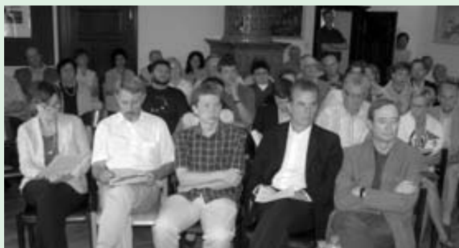
Hochkarätiges Publikum im Sitzungssaal

Europa wächst zusammen. Grundlage dafür ist das Vorhandensein guter Verkehrsverbindungen. Dies betrifft sowohl die Bahn- als auch die Straßen- und die Flugverbindungen. Doch nicht immer stoßen die Pläne für bessere und schnellere Strecken auf ungeteilte Zustimmung. Mitglieder einer Bürgerinitiative demonstrierten vor Schloss Forchtenstein und forderten die Aufgabe von Plänen zum weiteren Ausbau der vierspurigen Straße zwischen Judenburg und Klagenfurt. Zwischen den Mitgliedern der Bürgerinitiative, die zur Aussprache ins Seminar gebeten wurden, und den Referenten des Seminars ergab sich eine heftige,