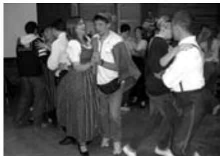
Musik und Tanz kennen keine Grenzen. Dichtes Drängen beim Lernen der Steirischen Volkstänze mit der Landjugend.